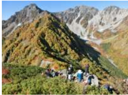
屏風のミミからの奥穂高、前穂高岳