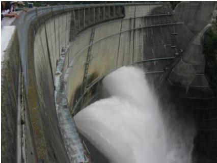
放流する黒四ダム

7月25日、早朝31名が参加してAM7:00扇沢駐車場に集合。アルペンルートのバス始発に乗り、ケーブルカー、ロープウェイを乗り継ぎAM9:00登山口室堂によりやく到着。準備をしてAM9:30出発。上空は曇天模様。雷鳥平に一旦下り、チングルマが群落する新室堂乗越を経由して、尾根伝いに別山乗越へ向う。途中風雨激しくなり、PM12:30ようやく辿り着いた剣御前小屋へ逃げ込む。