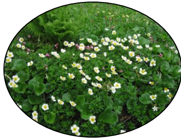
チングルマの群落