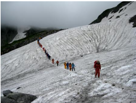
剣御前の山腹に残る雪渓を渡る

雨を避けて剣御前小屋内での昼食後、風雨について残雪多い剣御前の山腹を巻いて下る。いよいよ雨本降りの中PM3:30剣山荘に到着、泊す。翌26日、AM4:00起床。雨が上がるが湿った濃霧が漂う。朝弁当を摂り、準備をして、AM5:15全員出発する。一服剣までの南斜面に、今は盛りとコバイケイソウが群落している。前剣までの急傾斜の岩場を登り、濃霧の中、剣岳本峰の岩場の登攀に挑む。