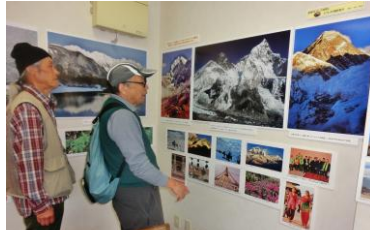
山岳写真展会場の視察・監修