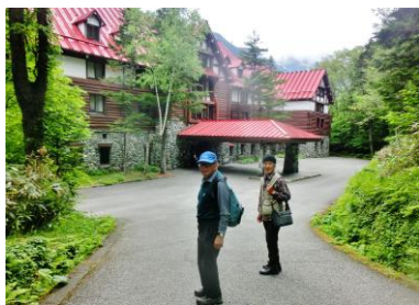
帝国ホテル玄関口にて

7日、雲の多い晴れの朝を迎える。朝食後 AM8:30、準備を整え、ホテルに別れを告げて、まず車に乗り込み(?)出発。バスターミナルに向かい、車を停車させ、そこから原生林の中に造られた帝国ホテル専用歩行道に行く。幅2mほどの道で、意外と歩きやすく、歩きだすと不思議に、深山幽谷の世界に入り込んだよう。鳥のさえずる声が林に響き、ウグイスがホーホケキョと鳴き、キビタキがさえずり、オオルリがひときわつやのある声で鳴いている。15分ほどで赤い屋根の大きな帝国ホテルに到着する。