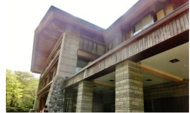
宿泊したアルペンホテル

入浴後、浴衣に着替え、PM6:00からの夕食を摂る。夕食をロビーで待つ間、冷えた瓶ビールで軽く乾杯！。そして、食堂の席に着くと、支配人からワイングラスに注がれた白ワインの差し入れが各人に配られ、いただく。この夜、少し酔いながら心地よい疲れの中、PM9:00前に静かに就寝する。