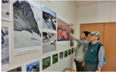
山岳写真展会場の視察・監修

る。作品の固定ピンが外れていないか、いたづらされていないか、などを視察する。いつも監視している食堂支配人は、「外国人や全国のお客さんは、作品を背景に、写真撮影するほど評判が良い」と言っていた。展示作品視察の後、引き返して河童橋を渡り、10分ほどで、対岸に建つアルペンホテルへ向かい、宿泊手続きをする。2Fのベッド式大部屋に、荷を置くと早速、大浴場に行く。たっぷりとした場に浸かり、今日の疲れを癒すことができた。浴場の湯は、上高地に流れる梓川の清水を沸かした、まさに天然湯だ！。湯は透明(?)で、肌にやさしい。