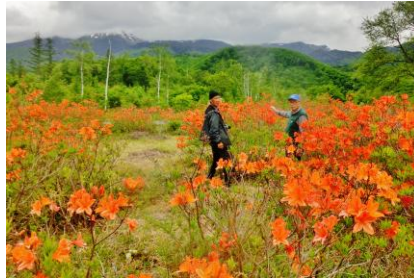
赤いレンゲツツジと乗鞍岳