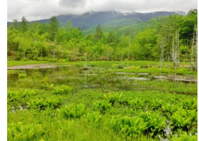
小さい花々が咲くどじょうの池

帝国ホテルでは、古い暖炉脇のソファーに座り、熱いコーヒーを注文する。参加者はここでの立ち寄りが楽しみだったようだ。買い物をしたり、コーヒーの味を楽しんだり、おしゃべりをして過ごす。