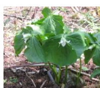
シロバナエンレイソウ