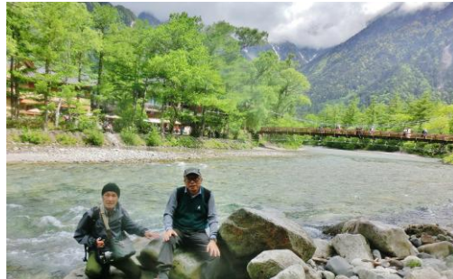
河童橋袂で梓川の飛沫を浴びる参加者。

雪解け水を集めて飛沫を挙げて流れる梓川、その流れに架かる河童橋からは、白雲に覆われた穂高連峰を望む。ここから右岸沿いの林道、また木道を歩き、明神へ向かう。1時間30分ほどで明神に到着。嘉門次小屋の名物、イワナの塩焼きは、長い行列待ちとなっているため、その順番を待つのを諦め、明神橋を渡った対岸で河原の日陰に陣取り、持参した手製のおにぎりの昼食を摂る。河原には、幾組かの同様な人たちも居て、涼風に吹かれながら、おしゃべりしながら食事をしている。