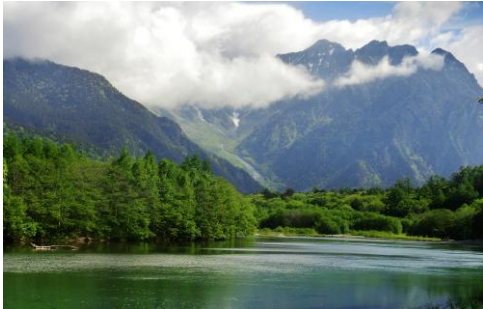
大正池畔からの稜線に雲がたなびく穂高岳

釜トンネルから15分ほどで帝国ホテル脇から、公園路に入り、今日の宿アルペンホテルまで進み、建物の背後に車を置き下車する。ほっと一息して、大自然の空気を味わう。見上げる青葉若葉の空に、鳥のさえずる声が響いている。ホテルの支配人に、車の停車の許しを得、今日の宿泊の挨拶をし、早速準備を整え、出発する。