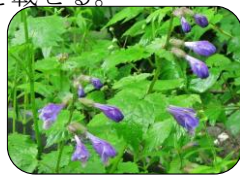
ラショウモンカズラ