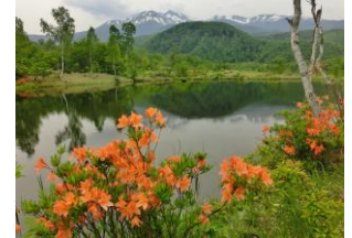
残雪の乗鞍高原一ノ瀬園地 まいめの池とツツジ