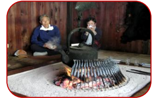
嘉門次小屋囲炉裏