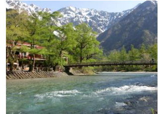
新緑萌える上高地

※撮影した写真は、2027.6 予定の井上デパートアイシティ21で行う(予定)松本ヒマラヤ山岳写真展に出品できます。