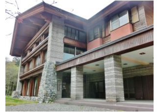
市営アルペンホテル