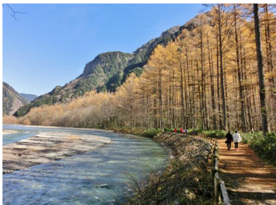
秋の落ち葉に埋まる梓川堤とカラマツ林