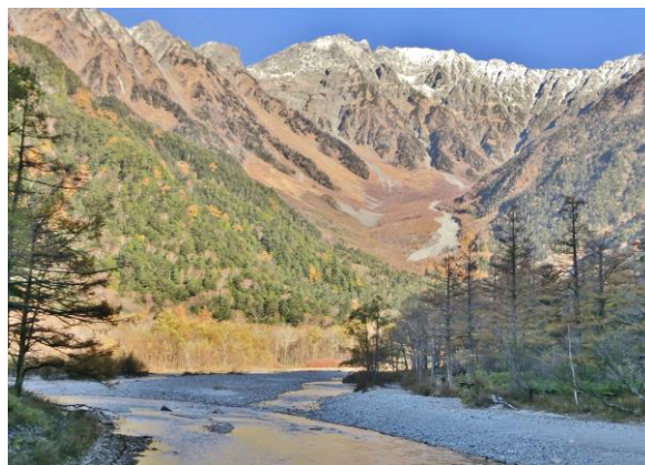
河童橋袂から見上げる新雪頂く穂高岳

新雪の穂高岳、明神岳の峰々を間近に望む紅葉の上高地には、槍ヶ岳を水源とする梓川が流れ、黄金色に紅葉した唐松林に囲まれた林道には、時折、野猿が姿を現します。第1日目の夕方、乗鞍高原の登り、熱いコーヒーを煎じてくれるペンション「ほうき星」に泊ります。この夜、風呂上がりに、骨酒とイワナの塩焼きに舌づつみを打つことでしょう。翌日、山深い乗鞍の紅葉を味わいます。