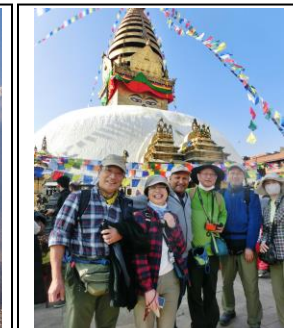
カトマンズ世界文化遺産訪問

そしてこれらの全ての事業は、 2024(令和6)年5/29(水)～6/3(日) の日程で、松本駅前の井上デパート本店7階大ホールにて 松本市カトマンズ市姉妹提携34周年記念事業「第6回ネパール文化紀行と報告写真展」 と題し、事業報告パネル写真と共に、参加した方々の作品を展示してまいります。出品していただいた優秀作品は、 ネパール大使賞、松本市長賞・カトマンズ市長賞・松本商工会議所会頭賞等(予定) として表彰し、 市民に開かれたネパール写真展 として開催したいと存じます。