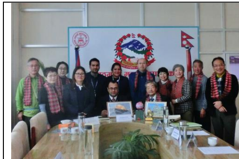
カトマンズ市役所へ表敬訪問

「参加者一行は、カトマンズ市を表敬訪問して、世界文化遺産を探訪し、アンナプルナ山群展望ハイキング、そして釈迦の生誕地ルンビニの訪問を行い、「 山と美しい自然 」を仲立ちとした松本市とカトマンズ市との姉妹都市交流の責任も果して参りました。その報告書をお送りいたします。