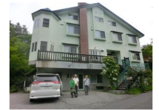
ペンションほうき星