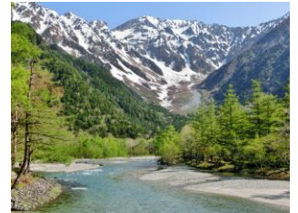
新緑萌える上高地

※撮影した写真は、是非2024.1末予定の井上デパート7Fで行う松本ヒマラヤ山岳写真展に、出品できます。