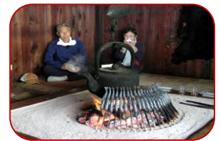
嘉門次小屋囲炉裏