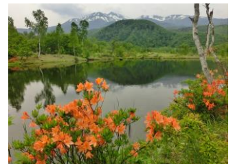
残雪の乗鞍高原―ノ瀬園地 まいめの池とツツジ